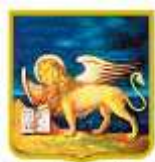
PATROCINIO REGIONE del VENETO